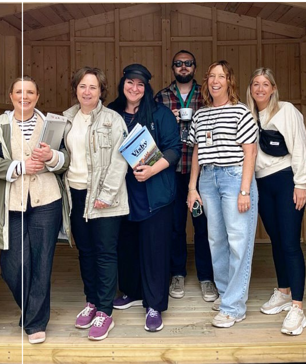
PROJEKTGRUPPEN INSPEKTERAR MARKNADSBODAR I MAJ 2025